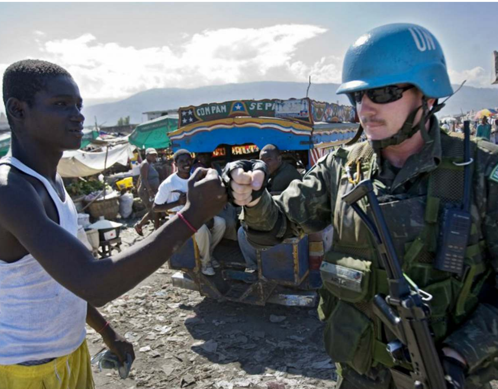
Le marché de la cité du soleil