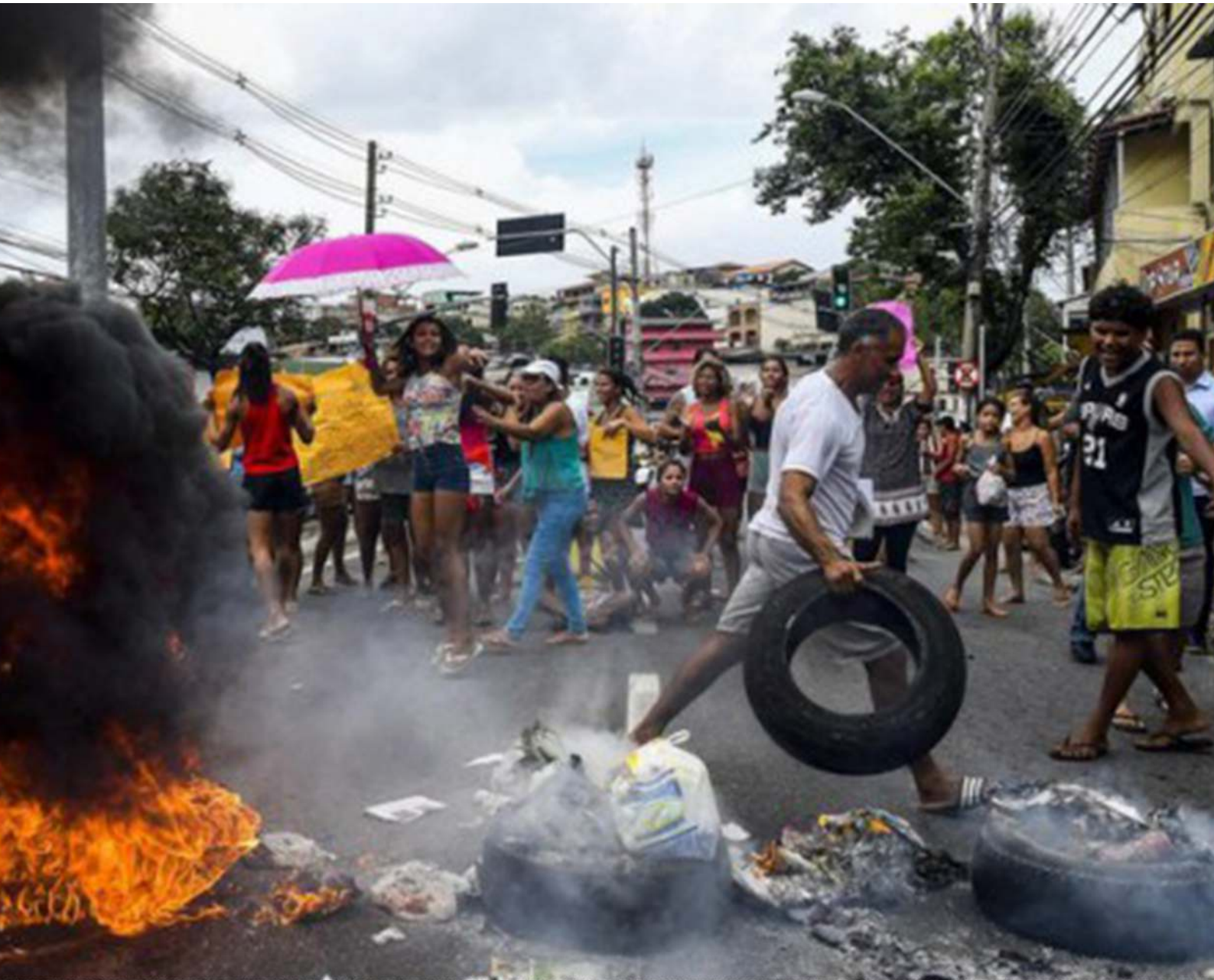
Scène de chaos dans les rue de Vitoria