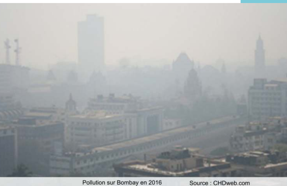
Pollution sur Bombay en 2016

En plus du charbon , du développement du parc automobile (de 5 à 15 millions de véhicules en quelques années), les usines de briques, les feux agricoles, les combustibles brûlés à l'intérieur des maisons aggravent la situation. Alors que le nombre de décès prématurés s'est stabilisé en Chine, que ce pays est devenu le champion du développement des énergies renouvelables, l'Inde commence tout juste à réagir. Le geste le plus visible a été de ratifier la COP 21 . De plus, l'objectif en 2022 pour l'Inde est de porter sa production solaire à 100 gigawatts, soit dix fois plus qu'en 2015.