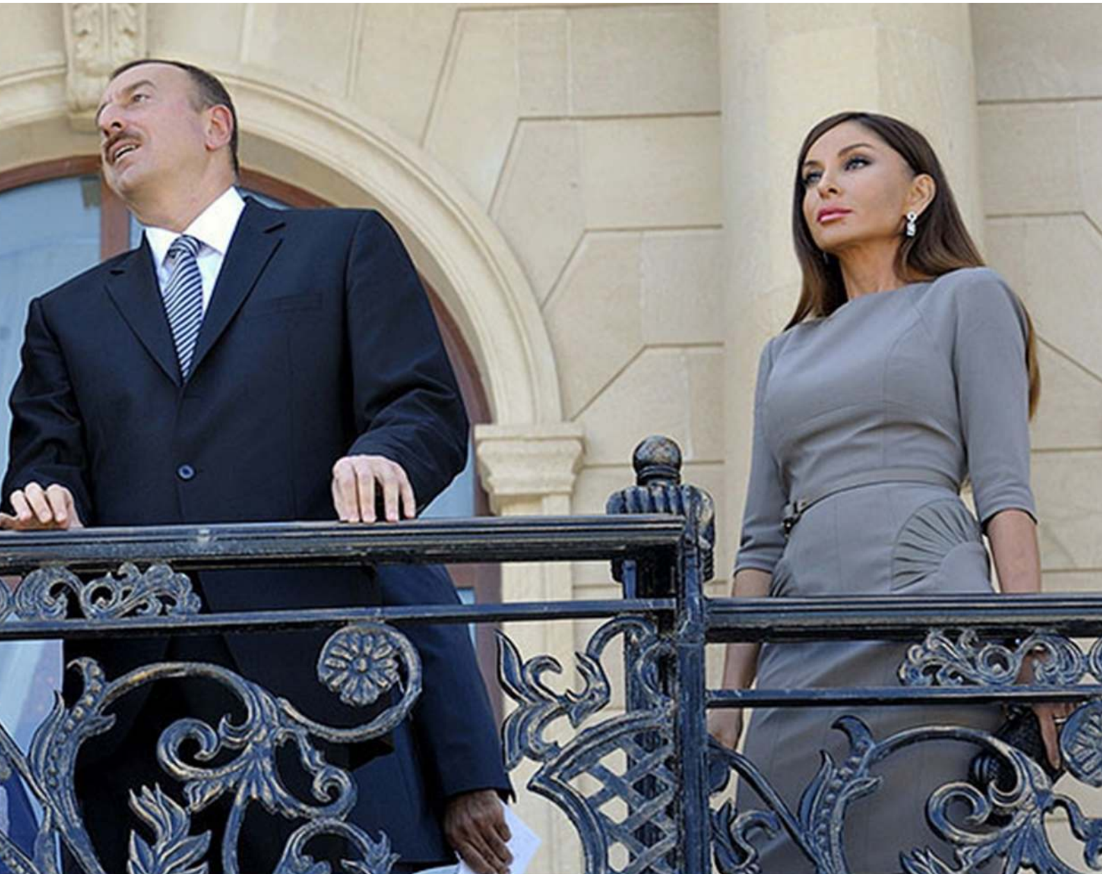
Ilham Aliyev et Merhiban Aliyeva à Bakou en octobre 2011